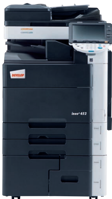
ineo+ 452 mit Job Separator (JS-504)

Wer heute verantwortungsvoll handelt, leistet seinen Beitrag für die Zukunft. Die ineo+ 452 ist ein praktisches Beispiel für den hohen Stellenwert, den der Umweltschutz bei DEVELOP hat. Sie ist mit dem blauen Umweltengel und dem Energy Star ausgezeichnet. Weil 40 Prozent weniger CO 2 bei der Herstellung des polymerisierten Toners als bei herkömmlichem Toner ausgestoßen wird. Weil mehr als 90 Prozent der Komponenten recyclefähig sind. Darüber hinaus verbrauchen die ineo-Systeme nur Energie, wenn sie laufen, und schalten sich automatisch ab, wenn sie nicht mehr in Betrieb sind.