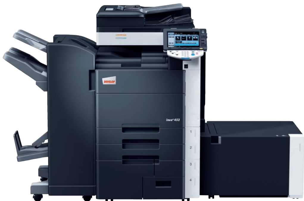
ineo+ 452 mit Heftfinisher (FS-527), Broschürenmodul inkl. Heft- und Falzeinheit (SD-509) und Großraumkassette (LU-204)