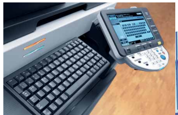
ineo 423 farbiges Touchscreen Display und optionale Tastatur für einfache Eingabe

Profitieren Sie von einem perfekten Team und nutzen Sie die ineo 423 für die Dokumentenproduktion in Schwarzweiß kombiniert mit den ineo+ Systemen für die Erstellung professioneller Farbdokumente.