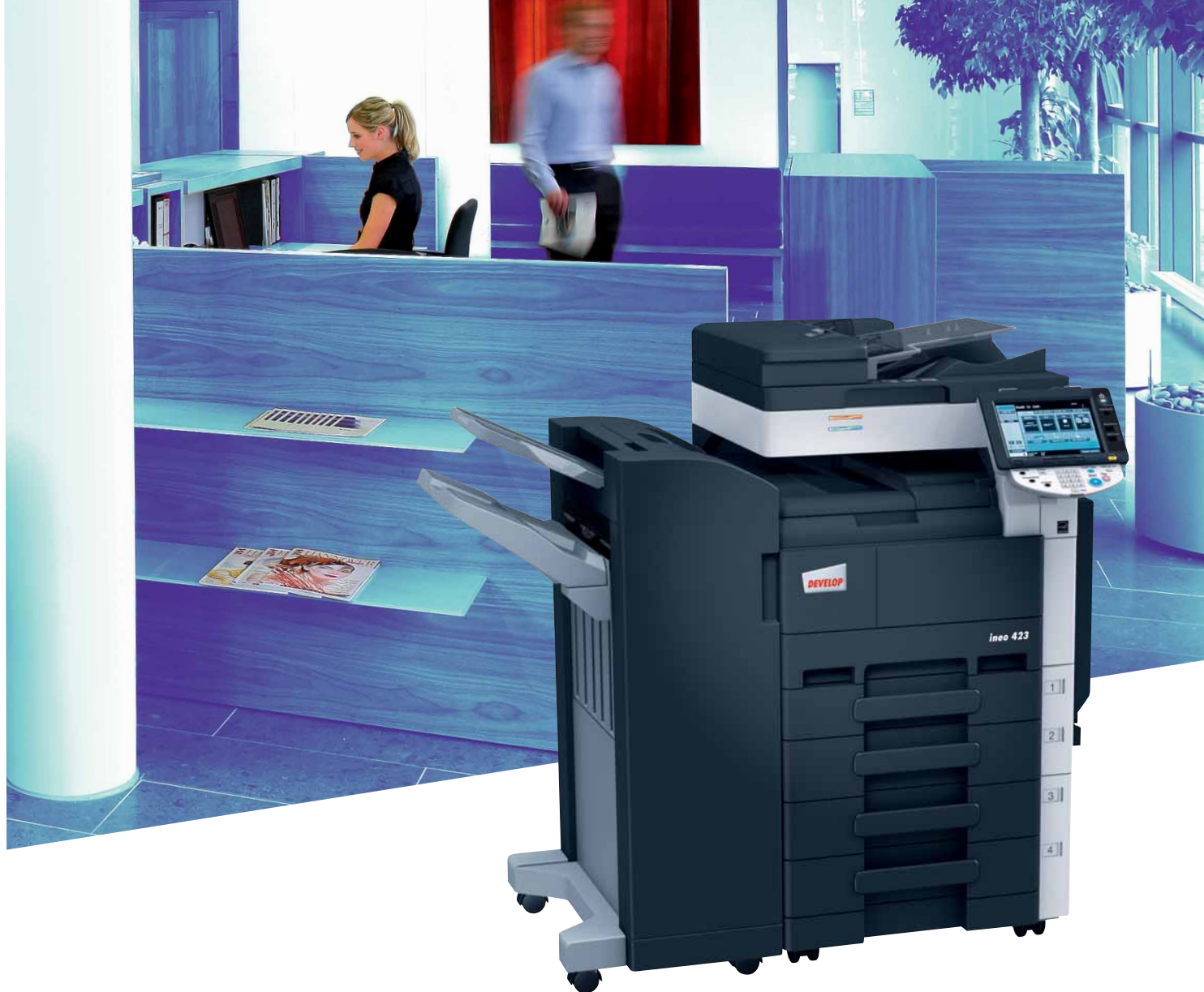
ineo 423 mit Standfinisher (FS-527) und Papierkassette (PC-208)