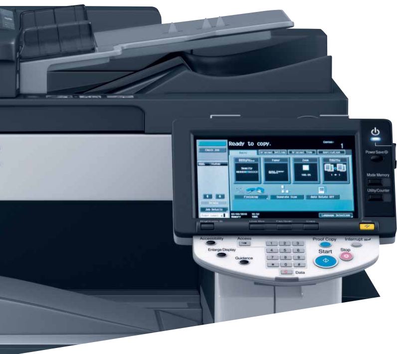
Das leicht bedienbare Farbdisplay der ineo 423

Die hohe Druckqualität in Verbindung mit einer großen Auswahl an Finishing-Funktionen ermöglichen es, selbst höherwertige Dokumente wie Broschüren inhouse zu drucken, zu lochen oder zu heften. Das steigert die Produktivität nachhaltig!